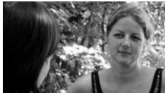
Bijna op de as: recht tegenover elkaar.