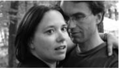
De bedrogen echtgenoot.

Neem nu de andere volgorde. Nu zien we de kijkende man als eerste. De vraag die dan gesteld wordt is: “wat ziet hij?” In het tweede shot krijgen we antwoord: hij ziet zijn vrouw met een ander zoenen. De vraag die zich dan opdringt is: “gaat hij weg of zullen ze hem zien?” In shot 3 komt het antwoord: ze zien hem.