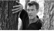
De betrapte minnaars.

Als je een scène begint met de shot van een hand die een pistool pakt, is de vraag direct: “wie pakt dat pistool en wat is hij ermee van plan?” Als je te veel ruimte achter iemand laat in een One Shot is de vraag: “wat gaat daar straks verschijnen?” Als je iemand laat aanbellen bij een onbekende deur, kun je hem rustig even laten wachten, terwijl het publiek zich afvraagt: “wie gaat er straks opendoen?” Als je echter de deur al eerder hebt gezien werkt het shot waarin de beller wacht niet – tenzij het dringend is. Dan is de vraag: “is hij wel thuis?”