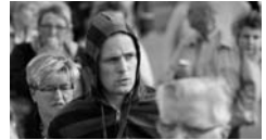
Nine is a crowd.

De telelens is de meest geschikte lens als je menigtes wilt opvoeren in je film. Als je een aantal mensen bij elkaar laat staan of met elkaar laat lopen, en je filmt die van een flinke afstand met een stevige telelens, dan krijg je een beeld waarin het lijkt of ze midden in een veel grotere groep staan. Doordat bij een telelens de afstanden kleiner lijken, lijken ze ook nog heel dicht op elkaar te staan of te lopen, wat mensen normaliter alleen doen als er weinig plaats is – dus in grote groepen. Een goede telelens kan zo een enorme hoeveelheid figuren schelen.