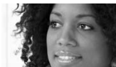
Zonder en met ooglicht.

Een punt van aandacht zijn de schaduwen. Zelfs al zitten je personages in een huiskamer met vier schemerlampen, een tv en een lamp boven de tafel: probeer hooguit één duidelijke schaduw te laten zien. Meer schaduwen levert een onverzorgd plaatje op en leiden af, zelfs al kloppen die schaduwen met de natuurlijke lichtsituatie.