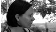
Objectief: minder confrontatie.