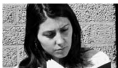
Invullicht van de zon door reflectiescherm. Boven: geen invullicht; midden: reflectiescherm op enige afstand; onder: reflectiescherm dichtbij.