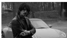
De luisteraar is soms interessanter dan de spreker.

Bovenstaande regels zijn uitgangspunten. Je wijkt ervan af zodra je een goede reden daarvoor hebt. Zulke redenen zijn al gauw gevonden, in diverse categorieën: